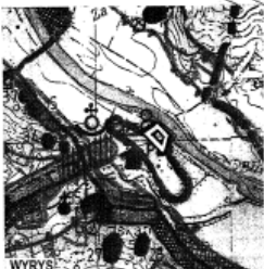
WYRYS: ze Studium Uwarunkowań i Kierunków Zagospodarowania Przestrzennego gminy DUBIECKO masz 1:10 000